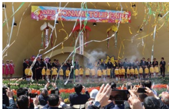
2023となみチューリップフェア(砺波チューリップ公園)