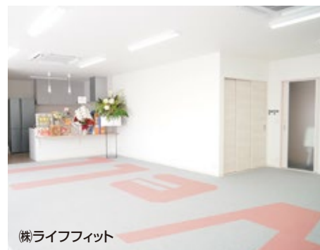
(株)ライフフィット