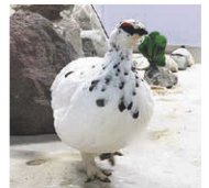
冬、羽毛を白色に変えたニホンライチョウ/ニホンライチョウの繁殖にも取り組んでいます。

お食事や体験「キリンに木の葉をあげよう」(土日祝限定、定員あり) 「オオカミにお肉をあげよう」「レッサーパンダのごっくんタイム」もあります。