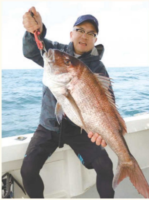
▲YEGの仲間と出掛けた福井の海で釣りあげた86cmのマダイ（通称 三国モンスター）

「YEGはビジネスや人脈を広げるだけでなく、年齢や業種が異なるメンバーとの会話の中で気づいたり、学んだりしたことも多かったです」